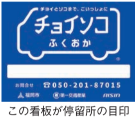
この看板が停留所の目印

現在、三苦駅・福工大前駅・和白駅の付近や住宅地の中など96カ所に停留所が設置されています。