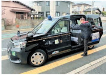
乗り降りしやすい車両

チョイソコの会員登録や乗車申し込みについては、チョイソコセンター(☎050-201-87015)へ。