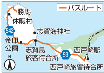
志賀島島内線 運行ルート

西戸崎駅や市営渡船の志賀島旅客待合所から、金印公園や休暇村志賀島などへのお出かけにも便利です。