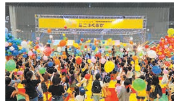
過去の「ミニふくおか」

「子どもがつくるまち・ミニふくおか」は、仮想のまちで子どもが働いたり遊んだりしながら、人との関わりを通してまちづくりや仕事を体験する催しです。イベント当日、①まちで生活する市民②会場整理・誘導など運営をサポートするボランティアスタッフ(事前研修会に参加できる人)を募集します。【イベント日時】3月26日(火)、27日(水)午前11時～午後4時【場所】南体育館(南区塩原二丁目)【対象】①市内に住むか通学する小学3年～中学生②高校生以上【定員】①各500人②各30人(いずれも抽選)【申し込み】2月1日以降にホームページに掲載、またはこども健全育成課(市役所13階)などで配布する募集チラシを確認して2月25日までに問い合わせ先へ。☎ミニふくおか事務局(子ども文化コミュニティ内) ☎070-1990-5071 ☒ info@mini fukuoka.jp