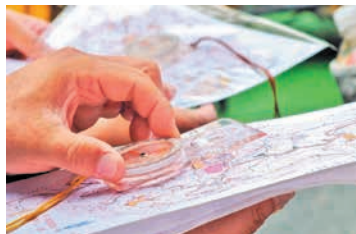
②はじめよう地図とコンパス