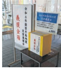
行政棟北側玄関の義援金箱

3月31日(日)まで市役所の行政棟北側玄関と議会棟玄関(午前9時～午後6時)、および各区役所・出張所(平日午前9時～午後5時30分)に義援金箱を設置しています。