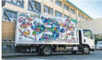
水素車両は音も静か

水素車両は水素と酸素を結合させて走るため、二酸化炭素を排出せず水しか排出しない、環境に優しい車両です。