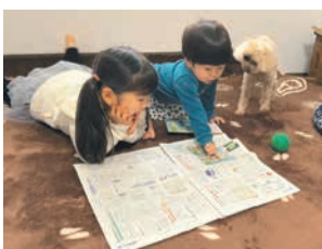
「間違い探しをしたよ」（東区 50代）

後、2級を受けましたが、残念ながら不合格でした。また今年受けようと思っています。