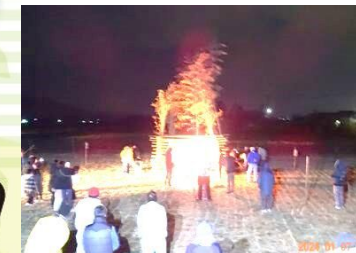
校区内の年男・年女による点火

1月7日(日)6:15より神事を執り行い、年女・年男(地域の方と小学6年生男女)の皆さんで6:30に太鼓の演奏と共に点火しました。この日は少し風が強くて煙で周りがみえない時もありましたが無事に終わることができました。暗い空に炎と、太鼓、時折響く爆竹音がとても印象的でした。