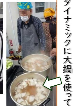
ダイナミックに大鍋を使って