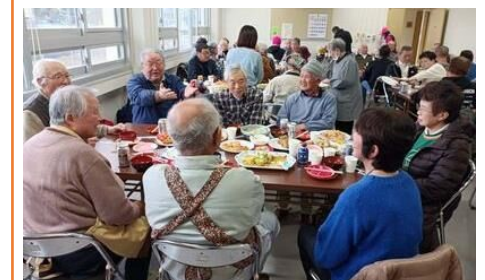
笑顔あふれる試食会(∩▽∩)/