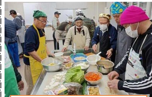
確認しながら作業を開始しました。

かしわご飯(長峰)ピザ・パエリア・オムレツ(明水ヶ丘)豚汁(北町)チキンカツ(陽光台)豚肉の白菜巻き(西町)肉じゃが(平尾新町)