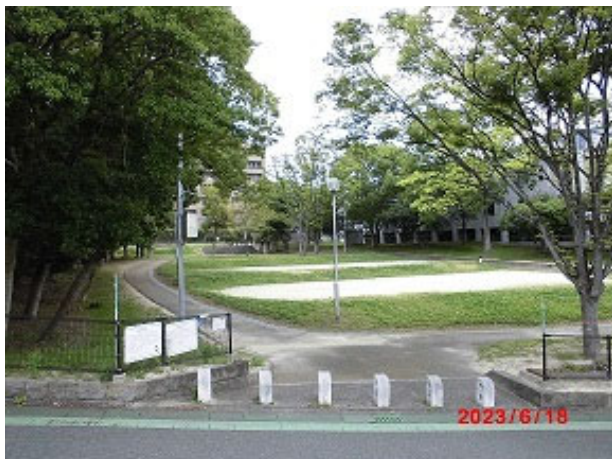
上:南西側出入り口からの風景 下:竹林の管理