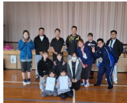
ビーチバレーボール A 本町