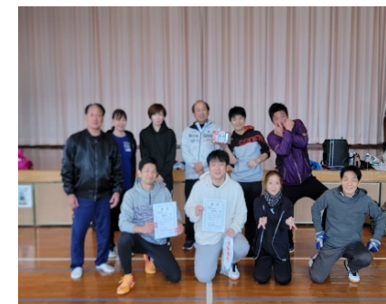
ファミリーバドミントン ビーチバレーボール B 新町