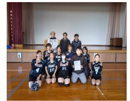
ママさんバレー秋季大会 新町チーム