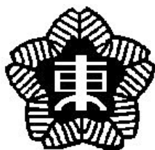
東福岡特別支援学校