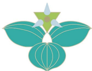
福岡中央特別支援学校