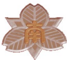
南福岡特別支援学校