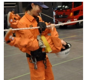
ちびっこレスキュー体験