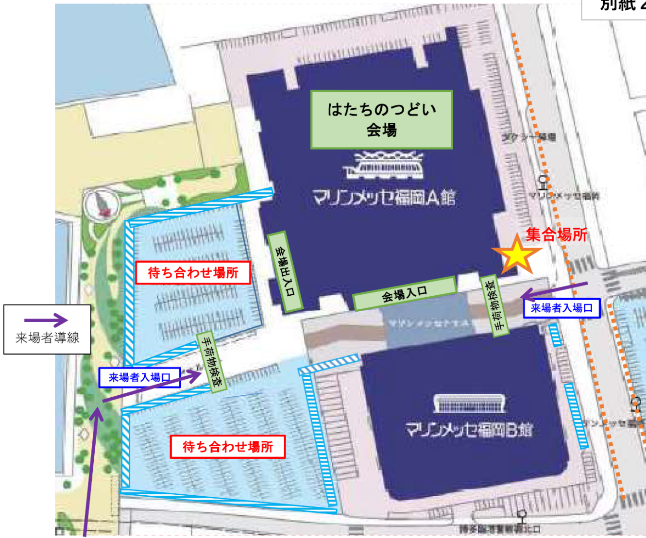
別紙2・場外平面図