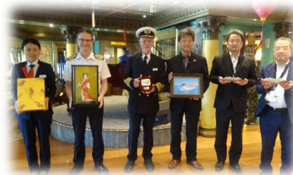
参考：メディタラニア（R5.10.2 寄港）初入港歓迎式典の様子