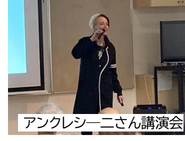
アンクレシーニさん講演会