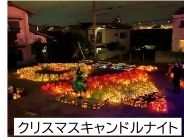
クリスマスキャンドルナイト