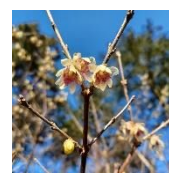
マツゲツロウバイ