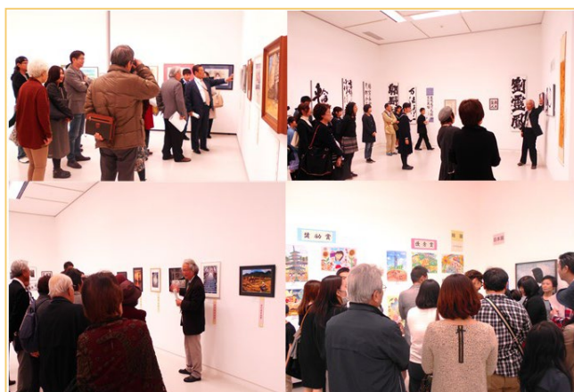
写真は令和元年度の様子

ギャラリーを巡りながら 審査員による作品講評を 聞くことができます！ ぜひ、ご参加ください♪