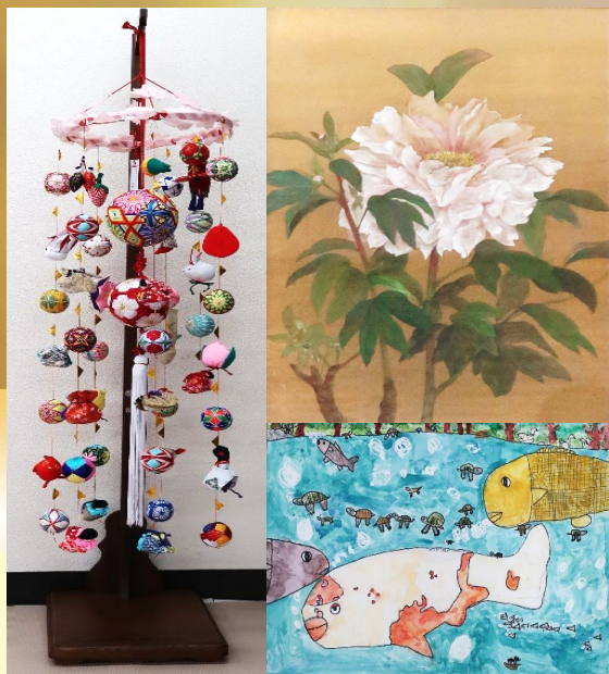
※写真は今年度の受賞作品