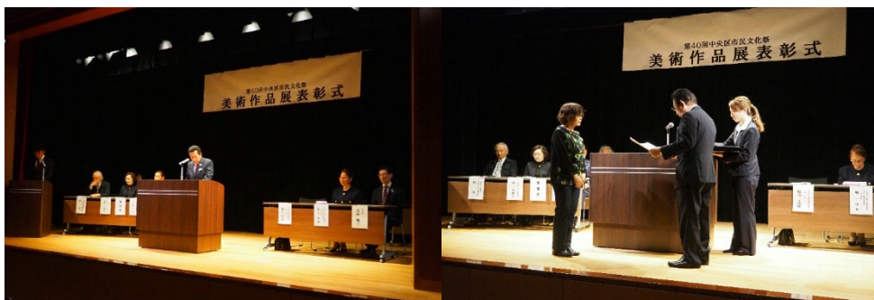
写真は令和元年度の様子