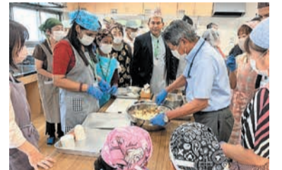
お互いの文化について学びながら、楽しくカレーを作りました

●若久校区の取り組み 若久公民館で、9月18日に地域住民と校区に住むネパール人との交流会が開催され、カレー作りを通して互いの文化への理解を深めました。