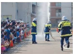
消防団員の募集も随時行っています

南消防団が日頃行っている、ホースを使った放水訓練や救助訓練などの火災現場活動訓練の成果を披露します =右写真=