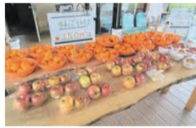
売店「花畑マルシェ」でのフルーツの販売

園内にある「花カフェ」では、旬のフルーツを使ったジュースを販売しています。10・11月に販売される季節限定ジュースは何でしょう。