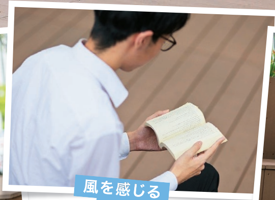
風を感じる 読書タイム