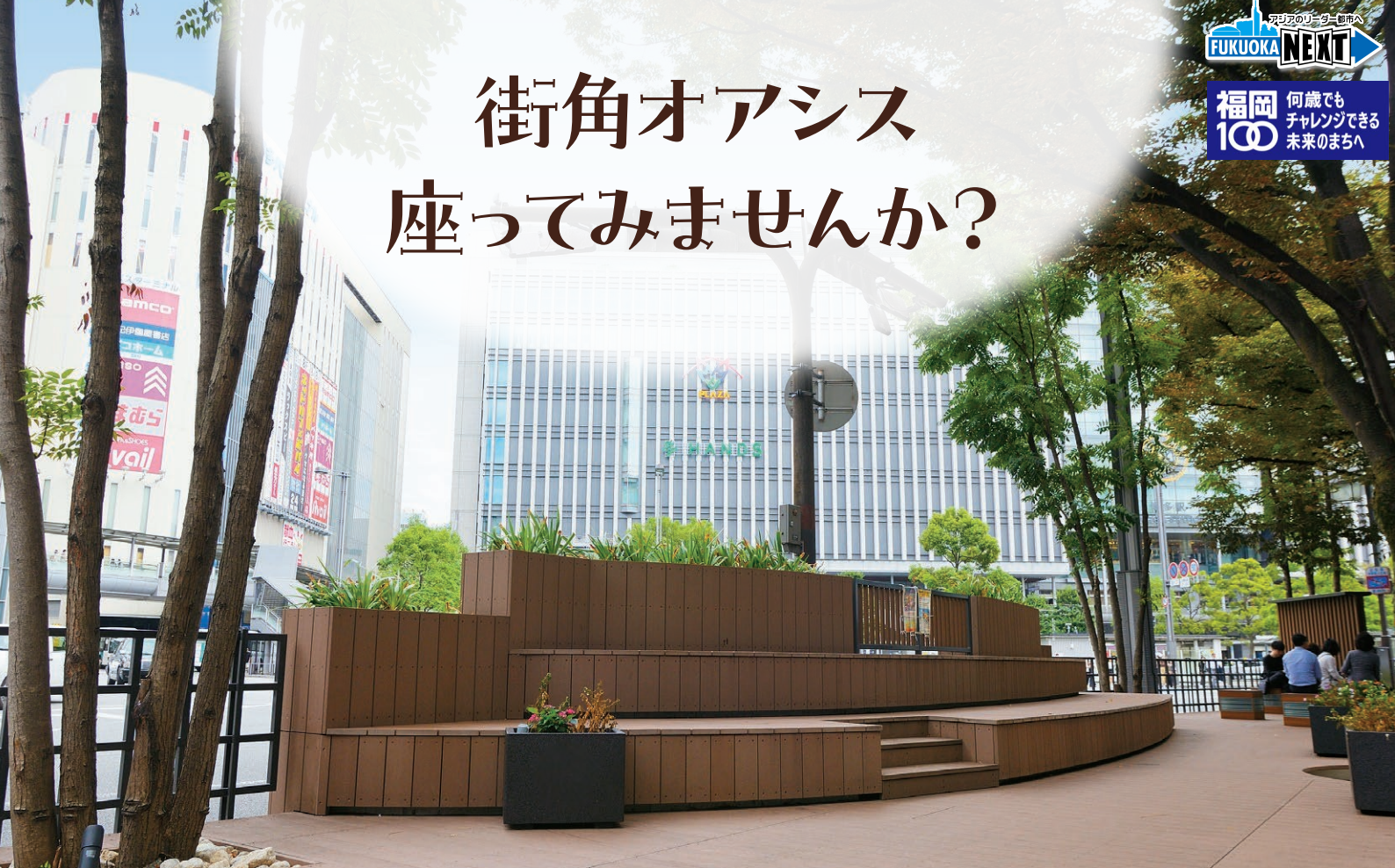
すきま時間に ほっと一息