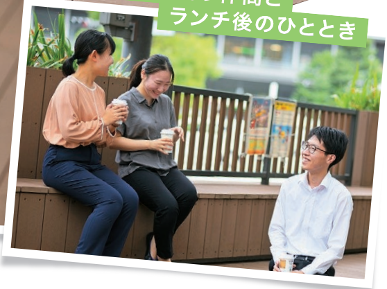
気の合う仲間と ランチ後のひととき