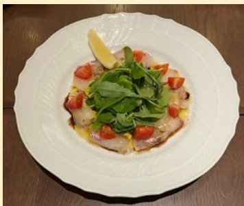
鯛のカルパッチョ