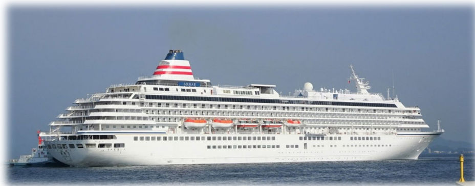
クルーズ客船「飛鳥Ⅱ」