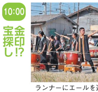
ランナーにエールを送ります

10:00 宝探し 砂浜に埋まったお宝を探すと、志賀島の特産品などが当たります。所志賀島海水浴場 中学生以下 下り先着100人 料100円 ※1人1回限り