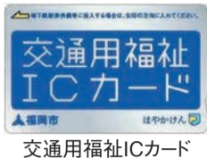
交通用福祉ICカード

市は高齢者の社会参加を促すため、交通費の一部を助成する「高齢者乗車券」を交付しています。令和5年度分の申請を受け付けています。