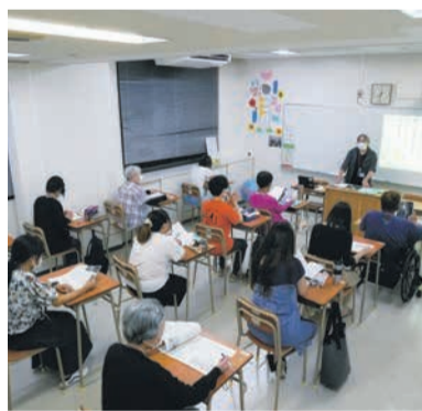
熱心に授業を受ける生徒たち