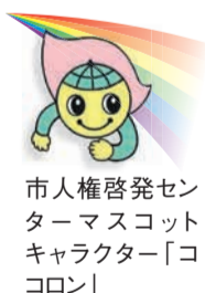
市人権啓発センターマスコットキャラクター「ココロン」

ル(中央区天神二丁目ソラリアステージビル6階)定460人(抽選)無料 10月23日(必着)まで下記コードから応募するか、メール(jinkenkeiha@city.fukuoka.lg.jp)へはがき(〒810-0073 中央区舞鶴2-5-1 あいれふ8階)またはファクスに氏名、電話番号、メールアドレスを記入の上、人権啓発センター(☎711-4338 ☎724-5162)へ申し込みを。