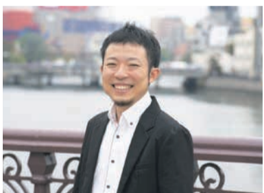
1985年生まれ、福岡市在住。NPO法人カラフルチェンジラボ理事。全ての人が本来の自分を発揮して共生共創できる社会づくりを目指す

性的マイノリティーについて知ろう 市は、国籍や年齢、性の違い、障がいの有無などにかかわらず、多様性を認め合いながら、誰もが生き生きと輝けるまちを目指しています。