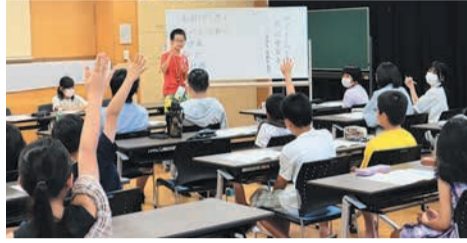
祭りを盛り上げるため積極的にアイデアを出す子どもたち

七隈校区では、地域の子どもたちが中心となって、夏祭り「サマータイム」を開催しています。子どもたちに企画することの難しさや達成したときの喜びを知ってもらい、地域に関心や愛着を持ってもらうと、青少年育成協議会七隈つくしんぼと七隈公民館が、平