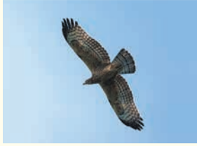
ハチクマ (油山市民の森)