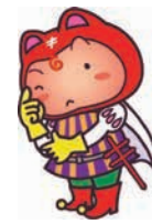
結核予防キャラクター シールぼうや

結核の症状は、咳(せき)、発熱など風邪の症状と似ています。早期に見つかり、通常の生活を送りながら、通院治療だけで治すことができます。抵抗力が弱い乳児は、1歳前までにBCG(結核のワクチン)接種を、65歳以上で胸部エックス線撮影を受ける機会のない人は、各区保健福祉センター等で結核・肺がん検診を受けましょう。問保健予防課 ☎711-4270 F733-5535