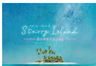
ドームのキーリーアイランド

太平洋に浮かぶジープ島の星空を紹介いたします。アロマを使用した作品です。大人推奨。未就学児は入場不可。開9月13日(水)～来年3月4日(月) 定各回220人(先着) 料1,320円 申当日午前9時半から3階チケットカウンターで販売。