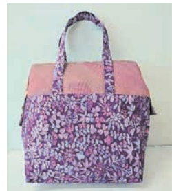
②着物地で作るワイヤーバッグ

一部講座は材料を持参。市内に住むか通勤・通学する人 ①1,000円②③500円④～⑧無料 申①②③はがきかファクス、メール(☎ seibuplaza2@f-kankyoo.or.jp)、来所で、9月①②22日③29日(いずれも必着)までに同施設へ。当選者にのみ通知。④～⑧電話かファクス、メール、来所で、④希望日の3日前まで⑤～⑧随時受け付け。