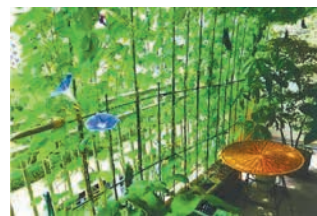
去年の最優秀賞作品(家庭部門 集合住宅の部)

同コンテストの応募作品を9月15日(金)から市ホームページで公開し、市民投票を実施します。【投票期間】9月29日(金)まで 問脱炭素社会推進課 ☎711-4282 F733-5592