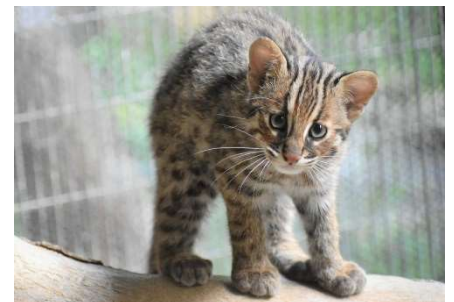
↑展示中の個体「アカツキ」 （令和4年撮影）

ガイド後、当日10月8日より販売開始予定の 福岡市動物園開園70周年記念誌「ツシヤママネコのあしあと」 をご紹介します。