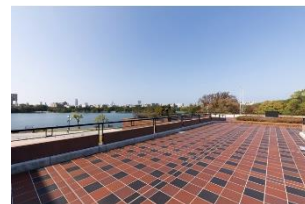
⑥市美術館 エスプラナード