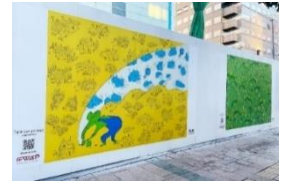
昨年度の掲出の様子

■ Fukuoka Wall Art Projectとは 美術分野のアーティストに建設現場の仮囲い等を活用し、まちなかでの発表の場と作品を展示・販売する機会を提供することで、アーティストのさらなる活躍につなげるとともに、アートによるまちの賑わいの創出を図ります。