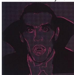
Andy Warhol Dracula from Myths

Andy Warhol Dracula from Myths 1981年 © 2023 The Andy Warhol Foundation for the Visual Arts, Inc. / Licensed by ARS, New York & JASPAR, Tokyo B0674