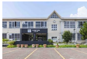
⑤Artist Cafe Fukuoka コミュニティスペース