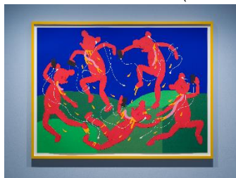
Simon Fujiwara Around and Around Who Goes? (Social Media)

Simon Fujiwara Around and Around Who Goes? (Social Media)2022年 ©Simon Fujiwara Courtesy of TARO NASU Photo by Yasushi Ichikawa