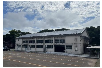
リニューアルした体育館外観

FaN Weekオープニングセレモニーも同会場にて実施し、一般公開前のセレモニー内で当該大型アート作品をお披露目 します。