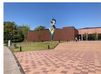
福岡市美術館 (福岡市中央区大濠公園1-6)

一般公開の前に、メディア様向けに事前内覧会を実施 しますので、ぜひご取材ください。