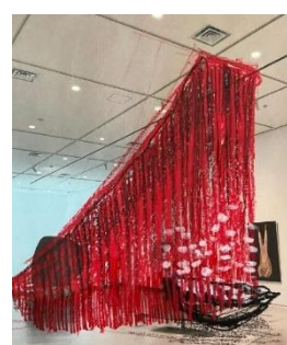
《記憶をたどる船》 プラン図