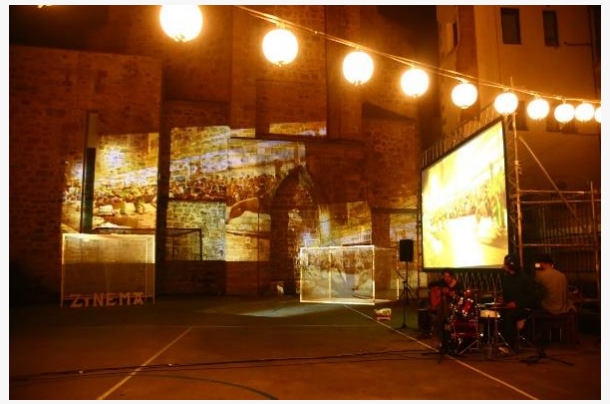
【「栗林 隆 + CINEMA CARAVAN」の過去の作品】