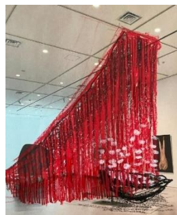
《記憶をたどる船》 プラン図