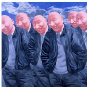
ファン・リジュン（方力均） 《シリーズ2No.3》1992年

福岡アジア美術館は、2024年3月6日に開館25周年を迎える。それを記念して、アジア美術の「オールスター」とも言うべき10名のアーティストの作品に出会っていただけるように企画。