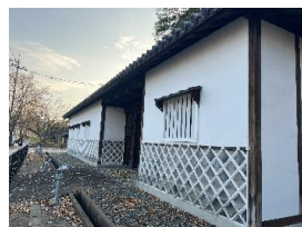
④旧母里太兵衛邸 長屋門