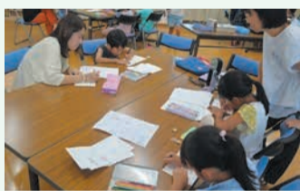
真剣に物語を考える子どもたち

1日目は、10ページにわたる絵本の中身を考えました。子どもたちは、どんなお話にしよう