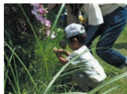
過去の同イベント

自然ガイドと一緒に散歩。㊟9月26日(火)午前11時～正午㊟未就学児と保護者㊟10人(抽選)㊟1人200円