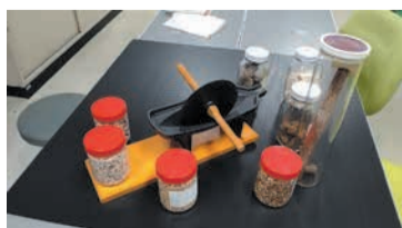
漢方薬の材料と作製器具

漢方薬の役割と作り方を学び、作製過程での色や香り、手触りの変化を体験。㊟9月30日(土)午前10時半～正午㊟小学生以上㊟30人(先着)