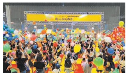
過去の「ミニふくおか」

来年3月26日(火)、27日(水)開催の「子どもがつくるまち ミニふくおか」は、仮想のまちを良くするための課題が書かれた「クエスト」にみんなで挑戦しながら、子どもがまちづくりを体験するイベントです。11月26日(日)にはミニふくおかを知ってもらう体験イベントも実施します。①まちの仕組みやクエストを考え、当日はスタッフとして活動する子ども実行委員②イベントの企画・運営や子ども実行委員を支援するサポーターを募集します。申し込み方法など詳細はホームページで確認を。 【活動期間】 10月～来年3月(10回程度) 【対象】 市内に住むか通学する①小学5年～中学生②高校生～25歳 【定員】 ①小学5・6年生30人、中学生30人②30人(いずれも選考) 同課 ☎070-1990-5071 ☎ info@minifukuoka.jp