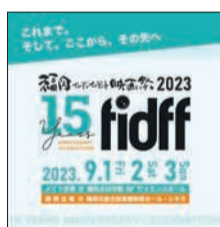
15周年記念ポスター