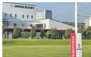
JAPAN BASE

9月8日(金)～10月28日(土)にラグビーワールドカップ2023フランス大会が開催されます。JAPAN BASE(香椎浜ふ頭一丁目)＝写真＝では、9月10日(日)午後8時から、日本対チリ戦を大型ビジョンで観戦することができます(入場無料、要申し込み)。