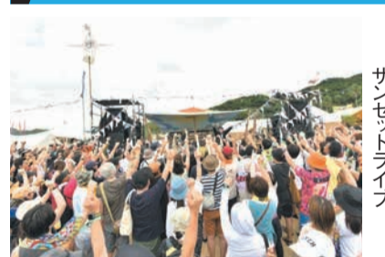
サンセットライブ