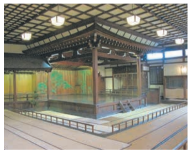
伝統的な様式と洋風の建築技術が一体となった劇場建築として、全国的にも貴重な建築物・住吉神社能楽殿

いずれも入場無料で、事前申し込みが必要です(申し込み多数の場合は抽選。神社解説ツアーのみ当日受け付け)。詳細は、ホームページ(福岡市住吉神社能楽殿くけら落とし)で検索)を確認を。