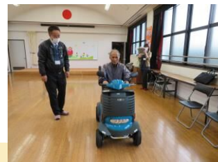
シニアカー試乗体験