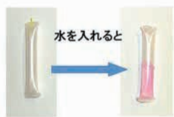
検査キット(塩素があるとピンク色に着色)

貯水槽があるビルやマンションなどに住み、塩素の有無を調べたい人に、簡単な検査キット=右写真=を区衛生課の窓口で無料配布しています。