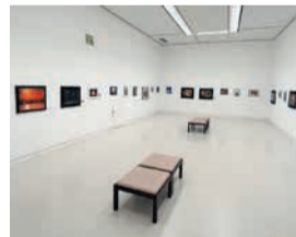
昨年度の美術展の展示風景(市美術館)

12月12日(火)~17日(日)に市美術館(中央区大濠公園)で開催する「西区市民美術展」の作品を募集します。絵画(洋画の部・日本画の部)、書、写真、工芸品の5部門で、応募は各部門1人1点に限りです。