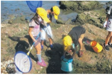
自然を生かした体験学習