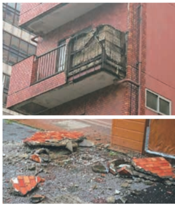
市内で起きた外壁の落下事例

には、外壁や建物に取り付けられた看板に関するものもあります。詳しくは、市ホームページ(「福岡市 特定建築物等の定期報告制度」で検索)でご確認ください。