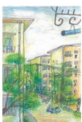
イラスト (早良区 70代)

住所・氏名・年齢を記入の上、はがきか封書、またはメール(☎shiseidayorioubo@city.fukuoka.lg.jp)で広報課「ハッピーボックス」係(〒810-8620住所不要)にお送りください。 ※氏名は掲載しません。 ■問い合わせ先/広報課 ☎711-4016 ☎732-1358