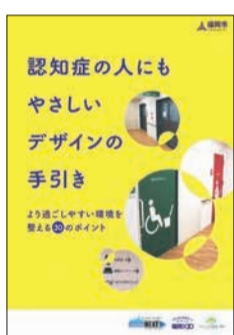
市が令和2年に作成した冊子