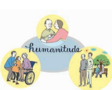
イラスト提供: 日本ユマニチュード学会