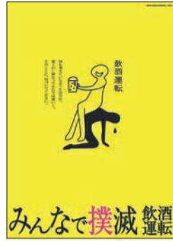
飲酒運転撲滅啓発ポスター

平成18年8月25日の海の大道大橋の飲酒運転事故から、今年で17年になります。市は、これまでさまざまな飲酒運転撲滅への取り組みを行ってきました。しかし、令和4年の飲酒運転による交通事故数は28件で、前年から5件増加している状況です。飲酒運転は「しない、させない、絶対許さない。それ