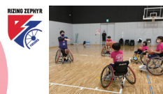
協力◆ライジングゼファーフォカ Wheelchair