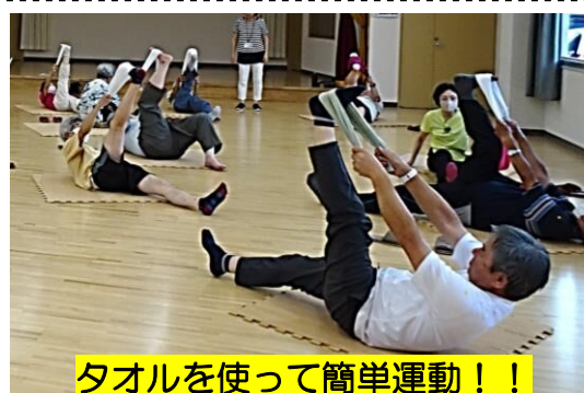
タオルを使って簡単運動!!