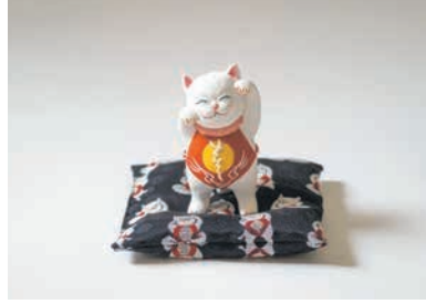
縁起が良いとされる招き猫柄の博多織の座布団と、博多人形の招き猫が「よか福」を招きます(18,150円)