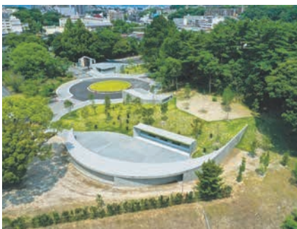
市立平尾霊園(南区平和)

埋蔵方法は、骨つぼからお骨を取り出し専用の袋に入れた上で、直接合同埋蔵室に埋蔵する「直接合葬」と、利用許可日から