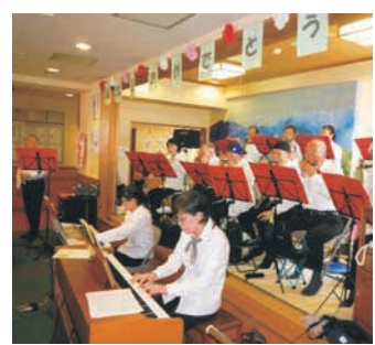
得意なことを生かしてボランティア活動ができます(シニアネットオーケストラ)

8月17日(木)①午前9時半～正午②午後1時半～4時 所々ふくプラザ3階 ①②各回50人 (先着) ☎電話(☎713・0777)かファクス(☎713・0778)、メール(✉kaigovo@fukuoka-shakyo.or.jp)、来所(中央区荒戸三丁目ふくプラザ2階)で8月1日以降に同センターへ。※登録には、市介護保険被保険者証(緑色)などの身分証明書が必要です。