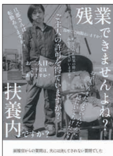
昨年度の受賞作品

一次審査の結果は、10月中旬に通知します。審査を通過した人は、10月28日(土)にアミカスで実施する公開2次審査で、作品のプレゼンテーションを行っていただきます(会場またはオンライン)。