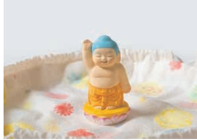
お月様のような博多織の巾着を開くと、かわいらしい花柄と博多人形の誕生仏が現れます(31,350円)