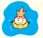
区のシンボルキャラクター 油山の妖精「ニコりん」

〒814-0192 城南区烏飼六丁目1-1 窓口受付時間: 午前8時45分～午後5時15分 (土日・祝休日・年末年始を除く) 区ホームページは「福岡市城南区」で検索