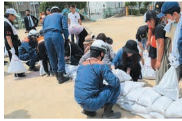
効果的な土のうの積み方を学ぶ地域の皆さん

問▷乗車申し込みなど=専用コールセンター ☎050-201-87015▷記事に関すること=市交通計画課 ☎711-4393 ☎733-5590