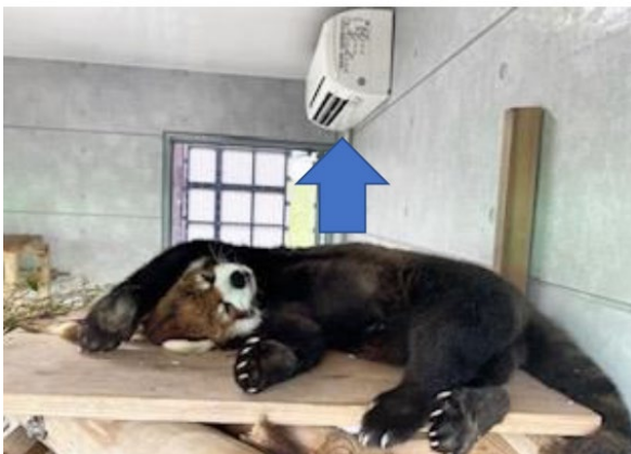
↑冷房の部屋で休むレッサーパンダ

福岡市動物園では、他にも動物たちの暑さ対策として、放飼場(屋外展示場)への水まきやミストの設置、暑さに弱い動物向けに空調設備を整えるなど、猛暑の中でも動物たちに健康を壊すことがないように配慮しています。今後とも、動物たちが快適に園での生活を送っていくよう、取り組んでまいります。