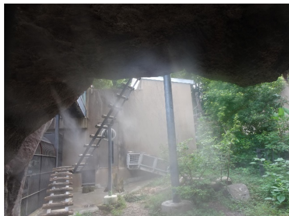
↑ミストを設置しているマレーグマ舎