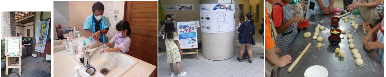
※これまでの体験型イベントの様子