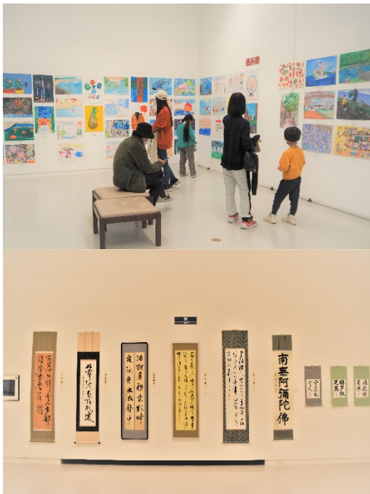
昨年度の美術作品展の様子