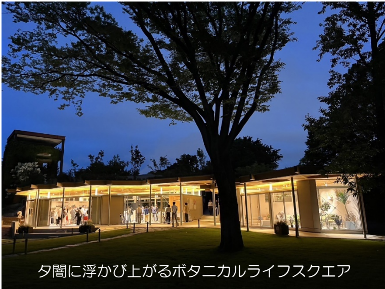
夕間に浮かび上がるボタニカルライフスクエア