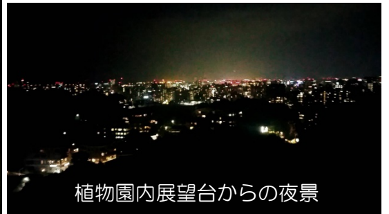
植物園内展望台からの夜景