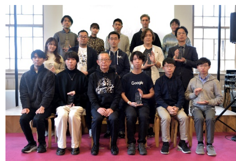
<昨年の表彰式の様子>

( https://efc.fukuoka.jp/award2023/ )をご参照ください