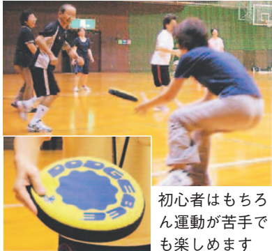
初心者はもちろん運動が苦手でも楽しめます

自分の体力に応じた運動は、生活習慣病の予防やストレス解消に効果的です。市立体育館・プールや区保健福祉センターなどでは、スポーツ指導員や保健師など専門家のアドバイスを受けることができます。教室を実施している