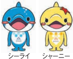
シーライ シャーニー

一方、言語や習慣、文化の違いや、互いの理解不足のために、騒音やごみの捨て方、駐輪問題などで地域住民とトラブルになることもあります。トラブルを未然に防ぐためには、地域の外国人と交流し、互いを理解することが大切です。 7月14日(金)から17日間、世界