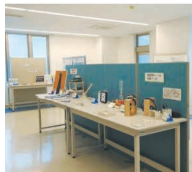
発達障がいの特性に応じた支援グ ッズなどを常時展示