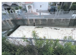
塗料が流入し白濁した川

油などの流入によって、河川で生物が生息できなくなるほか、水道や農業用水として使用