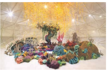
ムルヤナ(インドネシア)《海の記憶》2018年、個人蔵。かぎ針編みで作者の記憶の中にある理想の海を表現し、環境問題に警鐘を鳴らした作品

世界水泳福岡大会開催を記念し、日本、韓国、インドネシア、ベトナムなどアジアで活躍する8人の作家が「水」をテーマに制作した大型の作品や映像を紹介します。 海洋環境をテーマにしたもの、水害の脅威に向き合いながら力強く生きる人々の姿を描いたもの、水や川・海などのイメージに