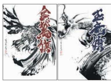
墨絵・陶墨画アーティストの西元祐貴氏が手掛けたポスター

香椎照葉六丁目)で開催され、全国から約1400校、1万人を超える高校生が集まります。