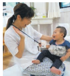
保育所は地域の身近な子 育て施設

詳細は、市ホームページ〔福岡市 未就園児の定期預かり〕で検索)でご確 認ください。記事に関する問い合わせ は、こども未来局運営支援課(☎711-4 114 ☎733-5718)へ。