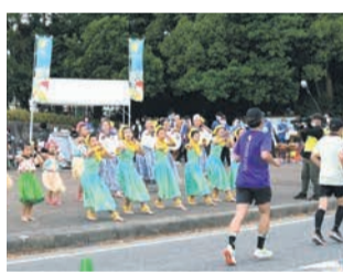
昨年の応援パフォーマンス

■問い合わせ先/福岡マラソン実行委員会 ランナー応援イベント担当 ☎711-4422 ☎733-5595