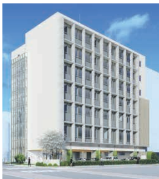
市舞鶴庁舎(イメージ)

発達障がい者支援センターと 障がい者就労支援センターが、 7月1日(土)、中央区舞鶴一丁目 に新しく開設される「市舞鶴庁 舎」に移転します。両センターを 同じ建物に集約することで、一 人一人に寄り添ったきめ細かな サービスを提供します。