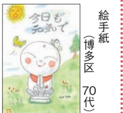
絵手紙 (博多区 70代)