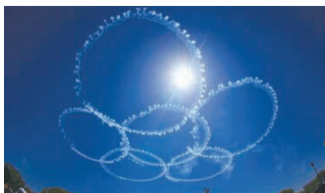
6機がスモークで花びらのような輪を描く技「さくら」

7月14日(金)午後2時ごろから、航空自衛隊のアクロバット飛行チーム「ブルーインパルス」が福岡市上空を飛行します。東区の海の中道、博多区・中央区の湾岸地域、博多駅上空のほか、