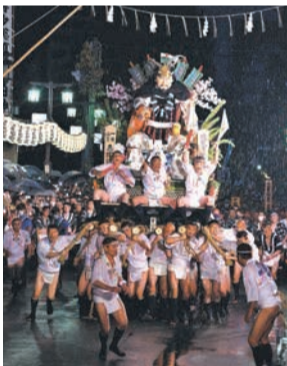
昨年一番山笠・恵比須流

博多祇園山笠 世界水泳が開幕した翌朝、15日(土)午前4時59分に、博多祇園山笠のクライマックス「追い山笠」がスタートします。一番山笠はコース途中まで。