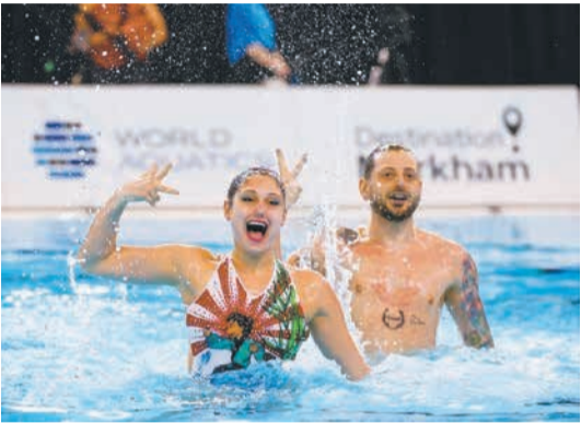
A Sの種目にはソロデュエット、チームがあり、規定要素を入れるテクニカルルーティンと自由なフリールーティンを演技チームはアクロバティックルーティン(56)に加わる。写真は混合デュエット

22年前、福岡大会で初めて使用された仮設プールは、それ以降世界中で採用されるようになりました。他にも、画面上に表示される国や選手名、泳ぐ選手と一緒に動く世界記録ラインなども福岡から始まった技術です。今大会も、福岡市ならではのコンパクトな大会運営で、より楽しめる大会を目指します。