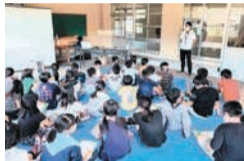
小学校での防災講座

災害発生時における「自助・共助の重要性」について理解を深め、地域防災力を向上させるため、地域と行政が共働した防災講座・訓練を行います。また、防災知識の普及を図る「早良区安全・安心フェスタ」を実施します。