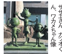
サザエさん、カオクくん、ワカメちゃん像

「サザエさん通り」周辺を巡るウォークラリーを実施するなど、学校や商店街、地域等と連携し、「サザエさん通り」を生かした共創によるまちづくりを推進します。