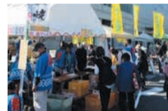
早良みなみマルシェ

地域、商工会、JA等と連携して、マルシェやイルミネーションを実施し、区南部のにぎわいづくりを進めます。