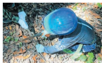
自然に触れる貴重な体験

期7月27日(木)、31日(月)、8月3日(木)、17日(木)、21日(月)。各日午前9時半~11時半所鴻巣山緑地(中央区小笹一丁目)の長丘中学校前の広場に集合・解散 小学生(4年生以下は保護者同伴) 定各回抽選20人 料無料