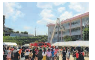
昨年度の防災訓練(筑紫丘)

近年多発している大規模災害に備えて、校区、消防・警察等の関係機関、企業と連携し、市民の防災意識向上を目的としたさまざまな訓練を実施します。