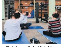
ストレッチなども行います