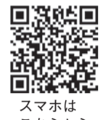
スマホはこちらから

問 市マイナンバーカード申請出張サポートコールセンター (毎日午前9時～午後6時) ☎600-2402 F733-5594 区内に住んでいる人 (お住まいの校区以外の公民館でも申し込みできます) 料無料