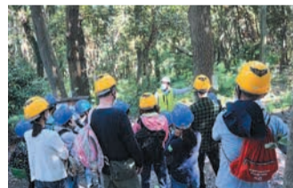
みんなで森の観察

鴻巣(このす)山で自然観察や森の保全体験、間伐材を使ったオリジナルスプーン作りなどを行います。親子で自然について楽しみながら学んでみませんか。