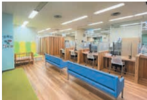
窓口は油山産の木を使用

子育てやDV、虐待などに関することを安心して相談できるよう、区役所の窓口をリニューアルしました。プライバシーにさらに配慮した環境の整備、キッズスペースの充実、木製カウンターの窓口の設置など、ぬくもりのある区役所づくりに取り組んでいます。