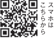
スマホはこちらから

【問い合わせ・申込先】 ①集団健診・よかドック総合窓口 ☎0120-985-902 F0120-931-869 ②健康課健康・感染症対策係 ☎559-5116 ③健康課母子保健係 ☎559-5119 ④健康課企画管理係 ☎559-5114 ⑤健康課精神保健福祉係 ☎559-5118 ②~⑤共通 F541-9914 ⑥地域保健福祉課 ☎559-5133 F559-5135