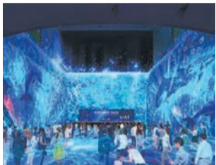
迫力あるプロジェクションマ ッピング(イメージ)

期7月14日(金)午後5時開 場 1,000円 ※6月19日(月) から販売。詳しくは、ホーム ページ(「世界水泳福岡 開会式」で検索)で確認を。