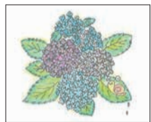
イラスト(早良区 70代)

(博多区 9歳) 運動会でダンスをおどります。ダンスリーダーになるためにいっぱい練習をしたら、ダンスリーダーに、えらばれました！とてもうれしかったです。