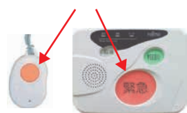
ペンダント 機器本体