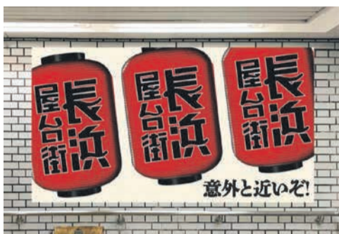
地下鉄赤坂駅構内の壁面装飾で、屋台街をアピール

市長は「市では、天神や博多旧市街など、各エリアの特徴を生かしたまちづくりが進んでいます。これに、アットホームで人情