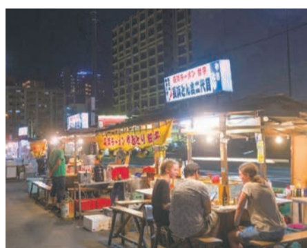
平成30年の長浜屋台街

味豊かなイメージの長浜屋台街が加われば、福岡はもっと魅力的なまちになるでしょう。期待しています」と話しました。