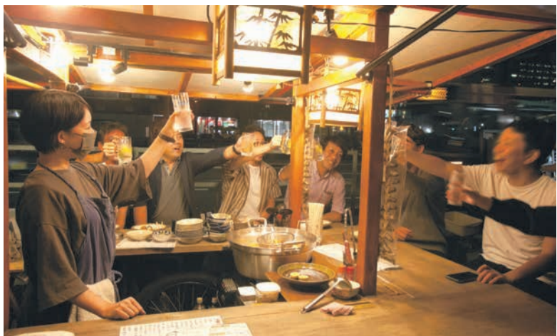
屋台は店主と客との触れ合いが魅力。県外からの宿泊客の約半数が訪れている

市内には現在106軒の屋台があります。このうち13軒は、6月から7月にかけて天神や中洲、長浜地区に順次オープンする新規屋台です。営業者の高齢化や人の流れの変化に伴い、屋台の数が減少していた長浜地区