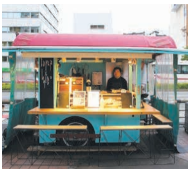
昨年度のグッドデザイン賞を受賞した「テラスとミコー」