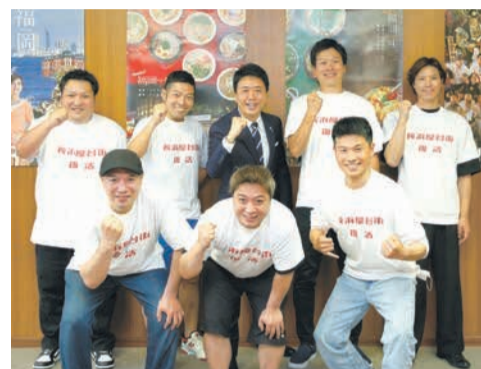
おそろいのTシャツ姿で市長と一緒に

から、店主たちは「魅力ある屋台街をつくっていきたい」と意欲を見せます。ラーメンや焼き鳥、おでん等の定番料理のほか、串揚げ、肉巻き、明太子料理、本場の中国料理など、バラエティーに富んだメニューが提供されます。