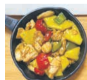
パイナップルと鶏肉の炒め煮

コンパクトで個性的な屋台がずらりと並ぶ福岡の屋台の雰囲気が好きで、中洲の屋台でアルバイトもしました。故郷中国の南部料理で勝負します。