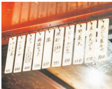
金額がはっきり表示されたメニュー