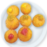
フルカウントコロッケ

ホークスが好き過ぎて、移住してきました。長浜に通い、たくさんの友人ができました。野球がコンセプトの屋台で、野球談義をしながら楽しく交流しましょう。