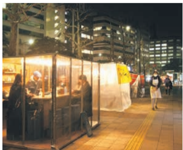
周辺には、人が歩けるスペースを確保