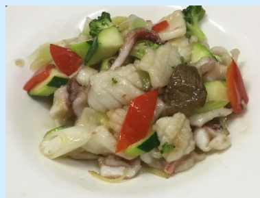
ヤリイカと季節野菜の塩炒め