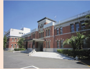
旧九州帝国大学本部事務室棟 (九州大学本部第一庁舎)

建設：1925年（大正14年） 規模：地上2階 構造：煉瓦 設計：倉田 謙 施工：佐伯工務所（現 佐伯建設）