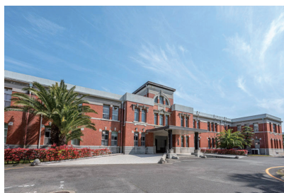
旧九州帝国大学本部事務室棟