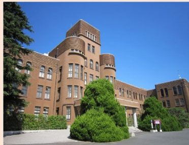
旧九州帝国大学工学部本館 (九州大学 旧工学部本館)

建設：1930年（昭和5年） 規模：地上3階 地下1階 塔屋付 構造：鉄筋コンクリート 一部鉄骨鉄筋コンクリート 設計：倉田 謙、小原 節三 施工：清水組（現 清水建設）