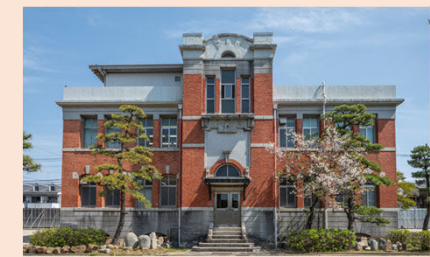
旧九州帝国大学本部建築課棟 (九州大学本部第三庁舎)

建設：1925年（大正14年） 規模：地上2階 地下1階 構造：煉瓦 設計：倉田 謙 施工：佐伯工務所（現 佐伯建設）