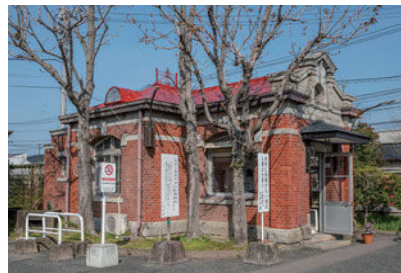
旧九州帝国大学門衛所

「近代建築物の保存活用プロジェクト～箱崎サテライト旧工学部本館改修支援事業～」のご案内 箱崎サテライトを学内外のより多くの皆様に快適かつ安全にご活用いただけるよう、九州大学ではこれらの建物について整備を計画しており、まずは工学部本館から改修することといたしました。皆様にはどうぞご支援を賜りますようお願い申し上げます。詳細は 九州大学基金HP をご覧ください。