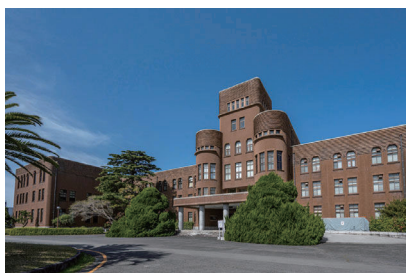
旧九州帝国大学工学部本館