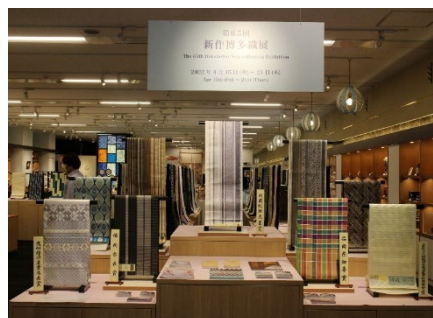
第65回新作博多織展 (昨年)