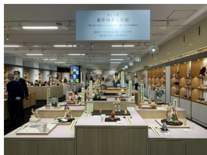
第72回新作博多人形展 (昨年)

*「伝統工芸 青山スクエア」は、一般財団法人伝統的工芸品産業振興協会が運営する全国の伝統的工芸品を一堂に展示・販売するギャラリー&ショップ。