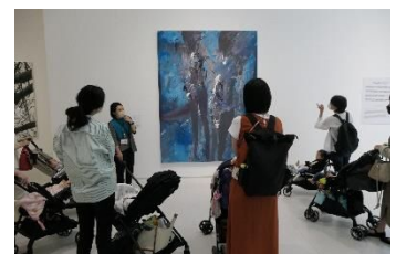
初めてのベビーカーツアー