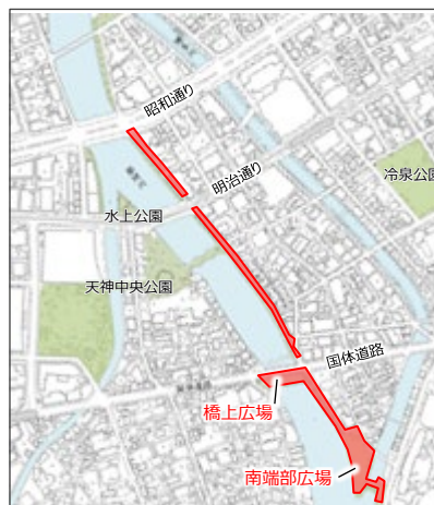
② 清流公園 （春吉橋迂回路橋上広場含む）